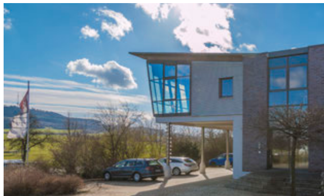
Das Verwaltungsgebäude in Ehingen

REHART GmbH Industriestraße 1 D-91725 Ehingen Tel. (0 98 35) 97 11-0 Fax (0 98 35) 524 info@rehart.de www.rehart-group.de